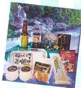
地元ビール会社とのコラボ商品「ジンジャーハニーエール」や学校と企画した「のべがくプリン」などのオリジナル商品が充実

苦味を効かせた定番のかまっちゃんソフト、宮崎特産日向夏のソフトをはじめ、季節の素材を使用したオリジナルソフトが人気。春はスイートスプリングが登場！