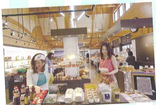
広い施設内におみやげ品がずらりと並ぶ

おみやげの品数では延岡一を誇り、地元企業や学校とのコラボ商品が多いのが特徴。東九州自動車道と国道10号線が交わる場所にあるので気軽に立ち寄ることができる。