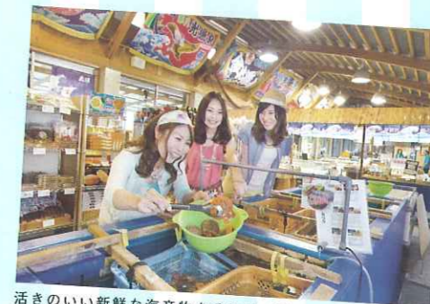
活きのいい新鮮な海産物をその場で購入できる

九州No.1の海水浴場「下阿蘇ビーチ」に隣接し、活きの良いヒオウギ貝などの新鮮な海産物や水産加工品、オリジナルの「北浦月の塩」を購入できる。「レストラン海鮮館」では、漁師町ならではの鮮魚料理が楽しめる。